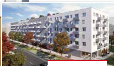
Bytový dům Polská